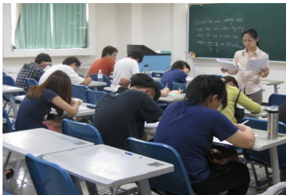
圖一、英文實力養成課程上課情形