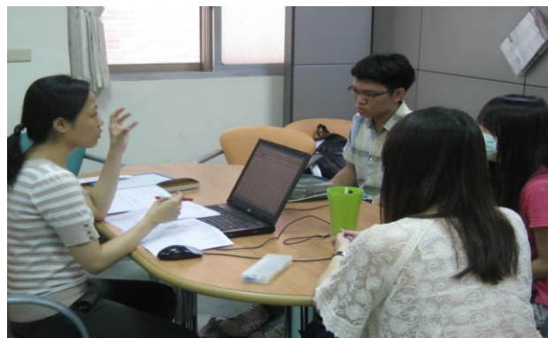
圖二、強化諮商輔導課程上課情形